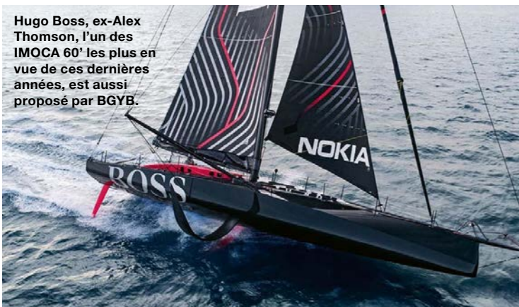
Hugo Boss, ex-Alex Thomson, l'un des IMOCA 60' les plus en vue de ces dernières années, est aussi proposé par BGYB.

BGYB est bien présent sur le marché d'occasion du superyacht, avec une expertise voile peu commune.