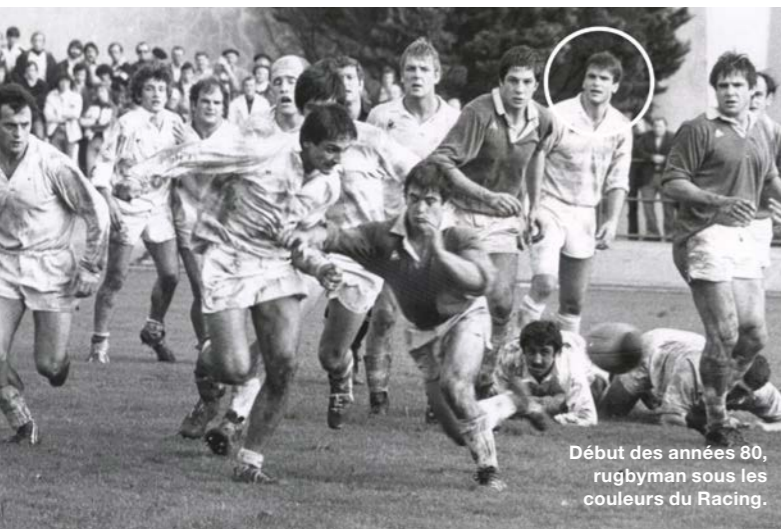
Début des années 80, rugbyman sous les couleurs du Racing.