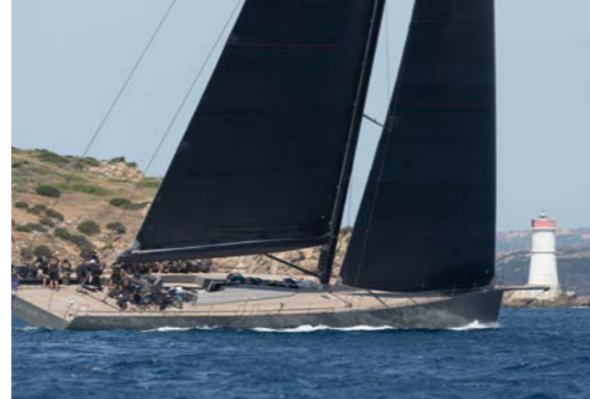
Fort de son expertise en voiliers, BGYB assure la vente de grands yachts de course-croisière. Ici, en régate, le fameux Wally Open Season (32 mètres).