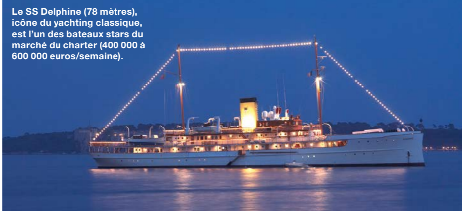
Le SS Delphine (78 mètres), icône du yachting classique, est l'un des bateaux stars du marché du charter (400 000 à 600 000 euros/semaine).