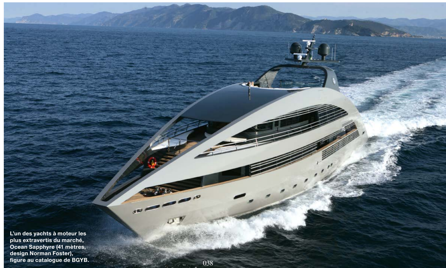
L'un des yachts à moteur les plus extravertis du marché, Ocean Sapphire (41 mètres, design Norman Foster), figure au catalogue de BGYB.

BGYB est bien présent sur le marché d'occasion du superyacht, avec une expertise voile peu commune.